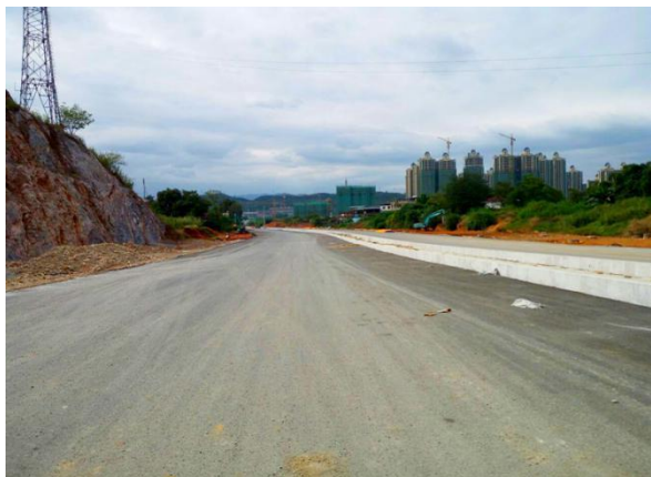
滨江路一期一标段剩余工程