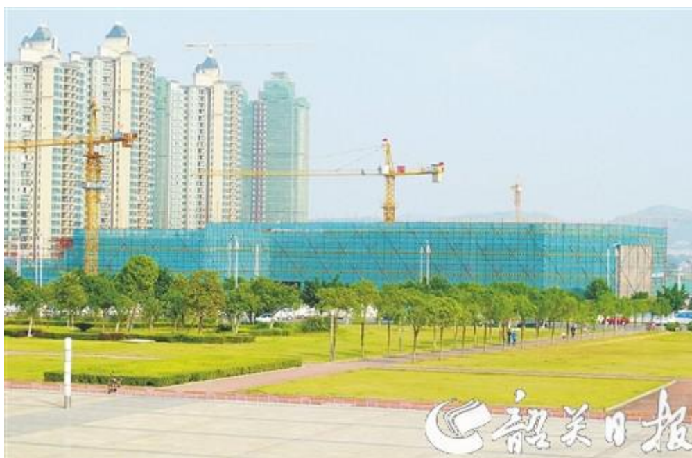
（图为建设中的武广客运枢纽综合枢纽）

今后，我司将继续立足于民生，切实践行企业社会责任，确保实现好、维护好、发展好广大人民群众的根本利益，承担起芙蓉新城建设的重任，履行好建设主体的职责，继续加快新城建设。（通讯员 朱引星）