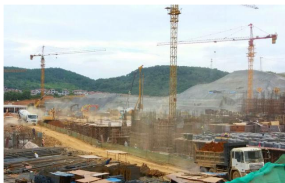
图为棚改三期建设现场