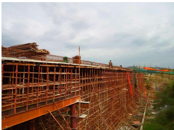
滨江路右幅右幅施工现场