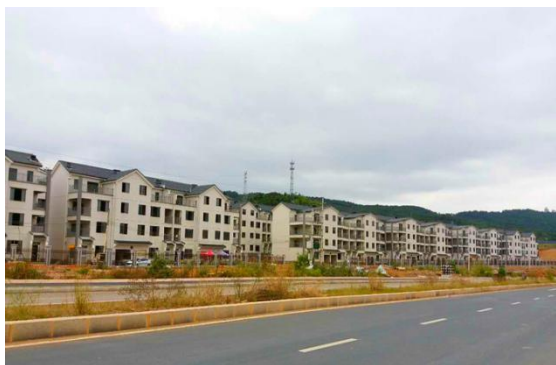
图为芙蓉安置房建设现场