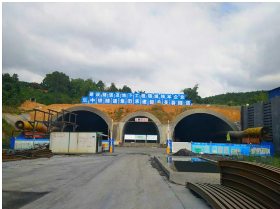
芙蓉隧道南端入口