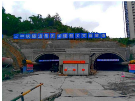
芙蓉隧道北端入口